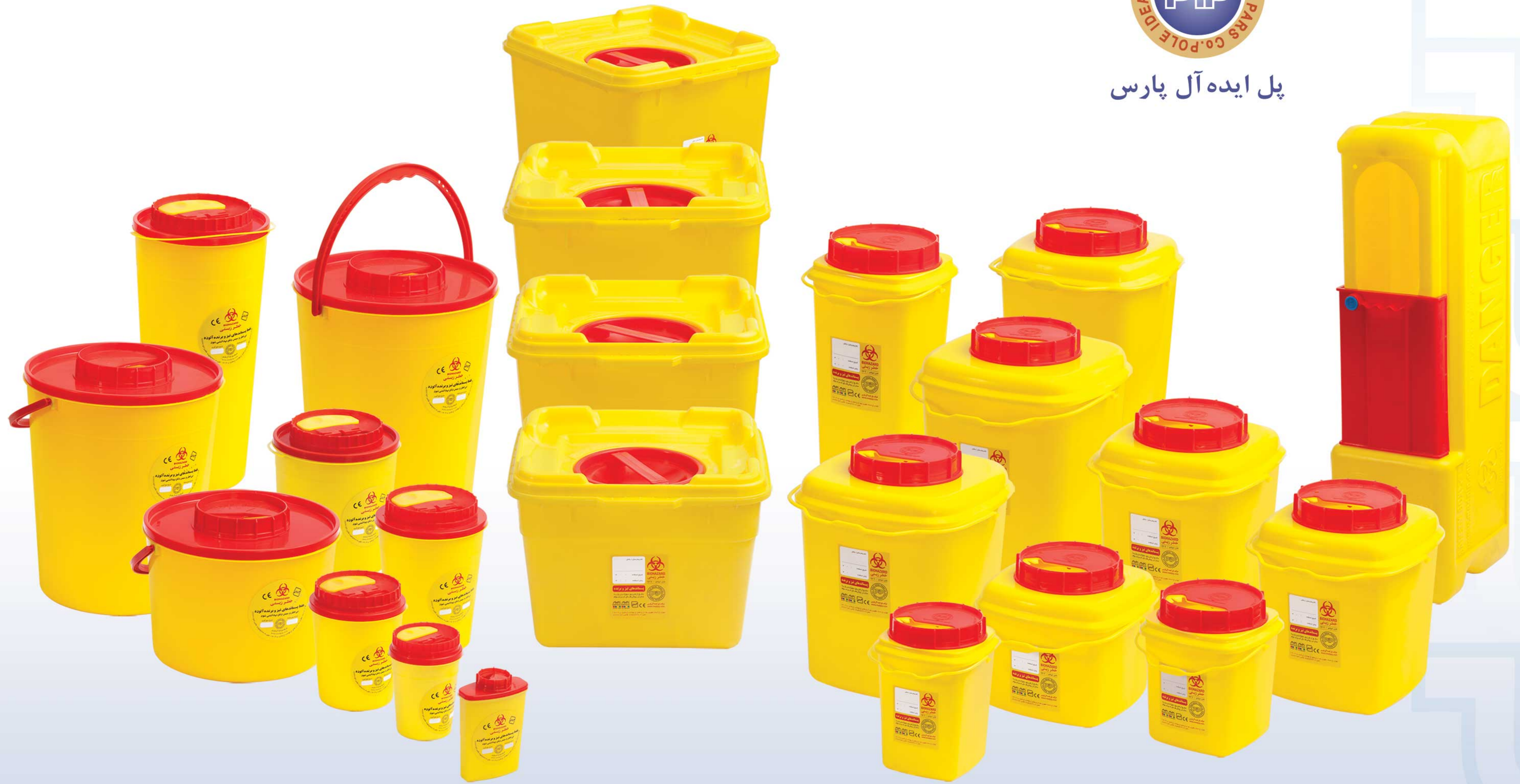
جدول راهنمای سiftی باکس های P.I.P.