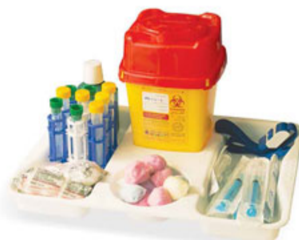
سینی تزریقات و پانسما

تهران، خیابان استاد مطهری، بعد از خیابان مفتح، خیابان جهانتاب، خیابان نقدی، پلاک ۱۲، طبقه اول کدپستی: ۱۵۷۶۶۳۵۷۱۴ صندوق پستی: ۹۴۸۳ - ۱۵۸۷۵ موبایل: ۰۹۱۲-۳۳۴۰۱۹۷ فکس: ۸۸۷۶۷۱۵۹ / ۸۸۷۶۵۵۶۱ تلفن: ۹-۸۸۵۴۵۹۲۲ - ۸۸۷۶۷۰۱۹ - ۸۸۷۶۵۹۱۵ - ۸۸۷۶۵۸۴۷ / www.medpip.com / info@medpip.com