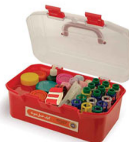
کیف حمل نمونه