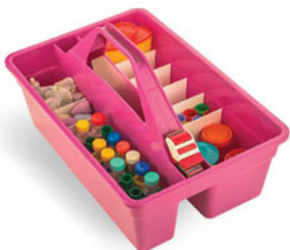
سینی نمونه برداری و حمل نمونه