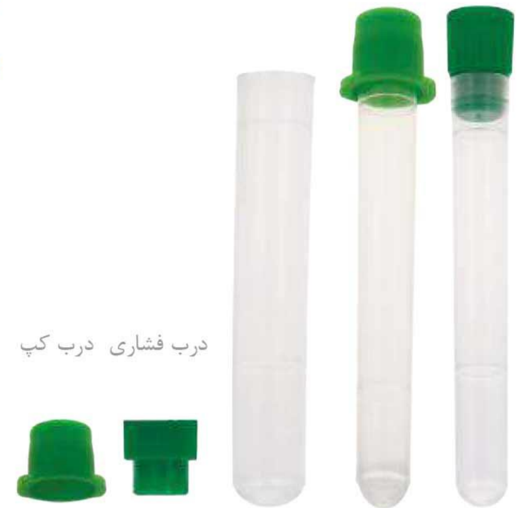
درب فشاری درب کپ

این لوله‌ها از پلی‌پروپیلن شفاف ساخته شده‌اند، یکبارمصرف می‌باشند و می‌توان از آن‌ها جهت نگهداری و انتقال انواع نمونه‌ها استفاده نمود. این لوله‌های آزمایش در برابر اکثر اسیدها و مواد شیمیایی رایج در آزمایشگاه