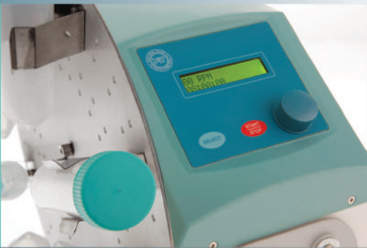
Rotamix PIT180 / PIT090