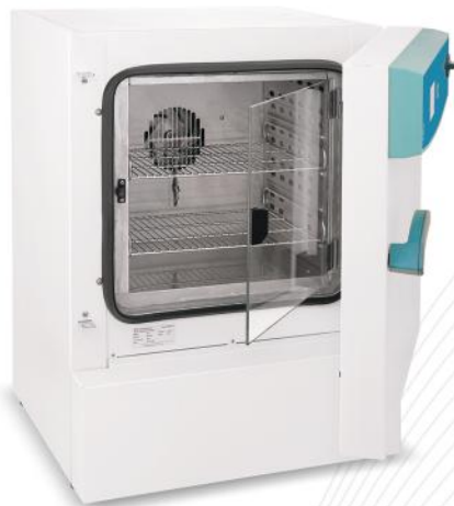
۵۳ لیتری (مدل کلاسیک و یخچال دار)