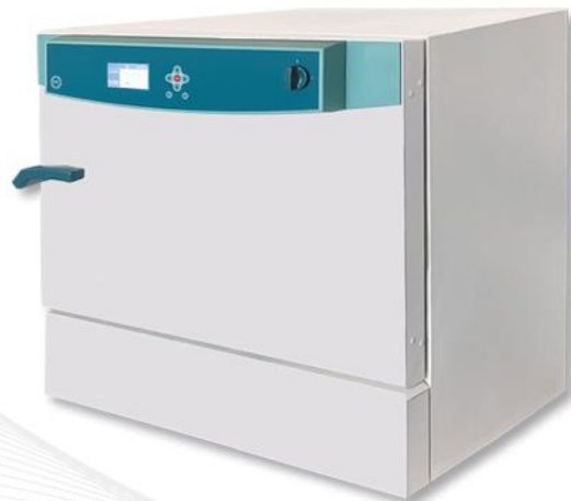
۱۱۵ لیتری (مدل کلاسیک و یخچال دار)